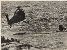
Riba e grafica aki un helicoptero y un barco ballero ta acercando e capsula espacial Sigma 7, despues di un acerbado descenso den Pacifico, di e astronauta Schirra.

"Egostanan", un comentarista di radio a bisa refiriendo na e balentian comunista.